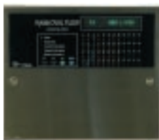
OVAL-MESSSTATION 16, 32 oder 48 Messpunkte/Station Speise- spannung 85-264 VAC