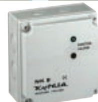
NK x x = Anzahl der möglichen Sensoren (2/6/12/24/30) Speise- spannung 24 VAC/VDC, 110/230 VAC Ausgang 10A, 250 VAC