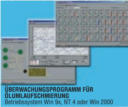
ÜBERWACHUNGSPROGRAMM FÜR ÖLUMLAUSCHMIERUNG Betriebssystem Win 9x, NT 4 oder Win 2000