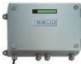
OVAL IO 16 Messpunkte/Karte Speise- spannung 24 VDC, optio 85-264 VAC